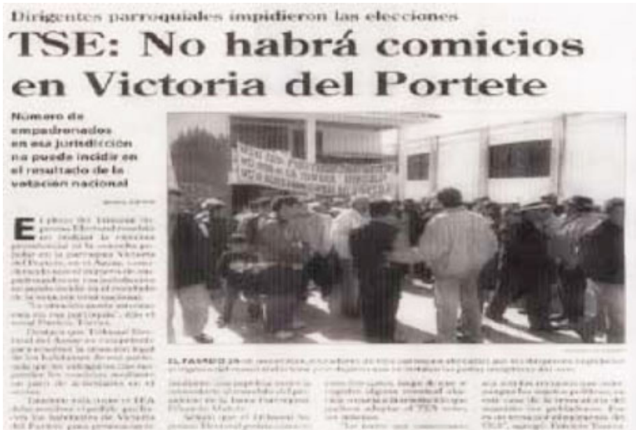
Nota: Ni policía ni ejército pudieron abrir el recinto electoral en Victoria del Portete, para elecciones del 2006, Diario El Mercurio, 2006.

Diciembre de 2006, el presidente del Tribunal Electoral del Azuay presenta denuncia penal ante la fiscalía en contra de dirigentes de la parroquia Victoria del Portete y de la Unión de Sistemas Comunitarios de Agua del Azuay por rebelión, al haber impedido realizar las elecciones en dicha parroquia.