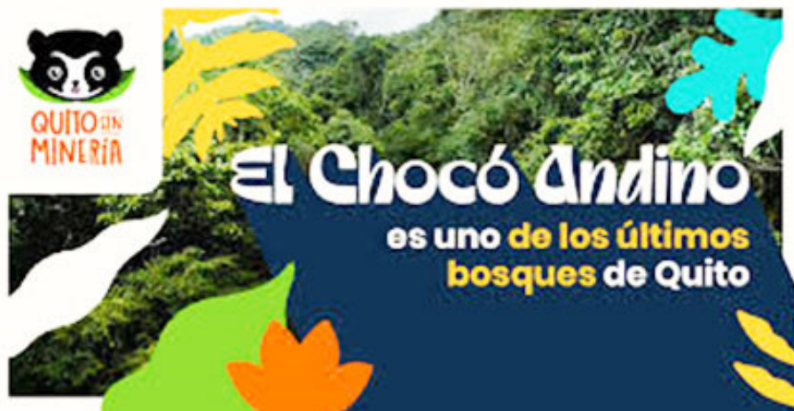
Imagen de la campaña Quito sin minería

Nota: A través de estos stickers se sensibilizó al pueblo de Quito cuidar el Chocó Andino, Acción Ecológica, 2023.